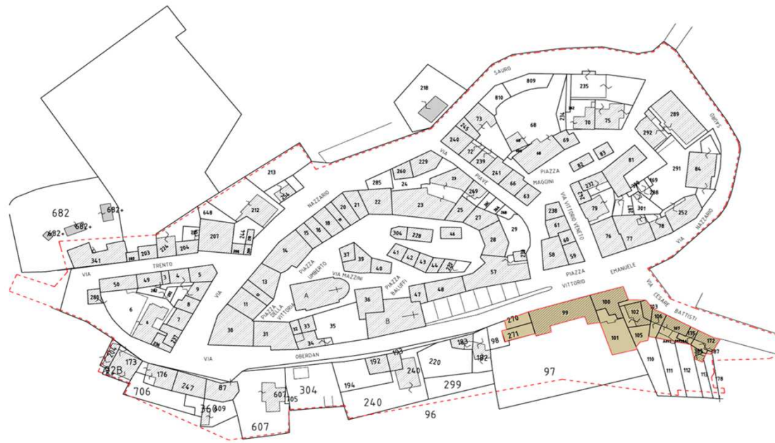
Planimetria di riferimento